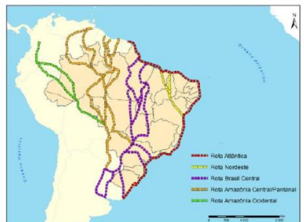
Mapas das principais rotas de aves migratórias nas Américas e no Brasil.