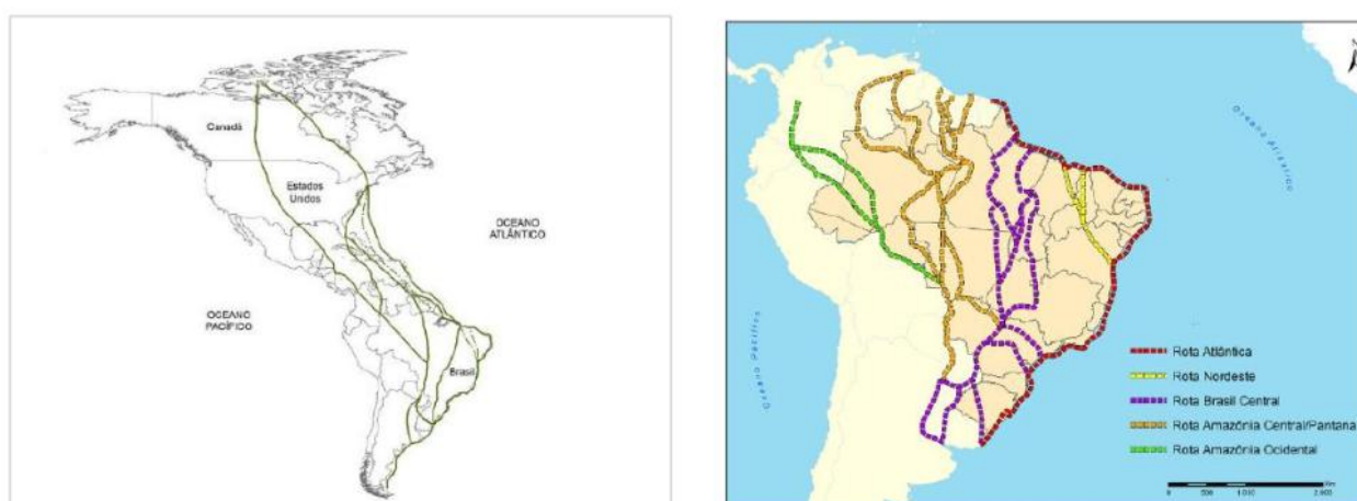
Mapas das principais rotas de aves migratórias nas Américas e no Brasil.

No dia 15/10/2019, a SESAPI confirmou o 4º caso de doença neurológica pelo vírus do Nilo Ocidental no Piauí. O caso corresponde a uma jovem que sofreu quadro de meningoencefalite grave, sobreviveu e ainda mantém tratamento ambulatorial. Não foi possível definir com extadião o local provável de infecção, pois a paciente esteve em três municípios durante o período de incubação estimado para a doença: Teresina, Lagoa Alegre e Cabeceiras. Até o momento, casos humanos de febre do Nilo Ocidental só foram registrados no estado do Piauí, mas casos em cavalos já foram confirmados nos estados do Espírito Santo (2018), Ceará (2019) e São Paulo (2019). O Piauí situa-se em rota de aves migratórias intercontinentais, o que pode contribuir para a ocorrência de casos (figura).