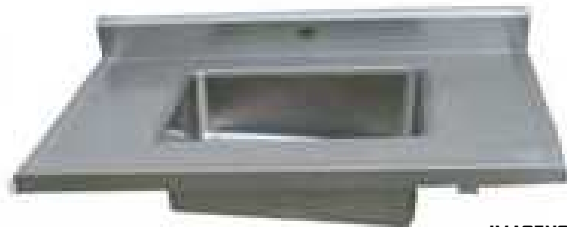
IMAGENS 04 E 05 BANHEIRA HIGIENIZAÇÃO RN (IMAGEM ILUSTRATIVA, DIMENSÕES EM CM)